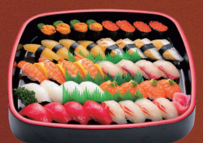
「上」にぎり5人盛 10,800円(税込) 4人盛 8,640円(税込) 3人盛 6,480円(税込) 1人盛 2,160円(税込)