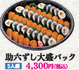
助六ずし大盛バック 5人盛 4,300円(税込)