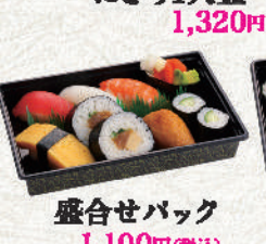
盛合せバック 1,100円(税込)