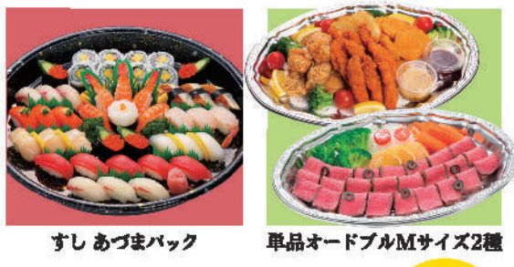
すし あづまバック デラックスセット 16,800円(税込) 通常合計価格17,800円(税込)

※単品オードブルMサイズ2種は、(すし・単品オードブルとも全てワンウェイ容器でお届けします。)