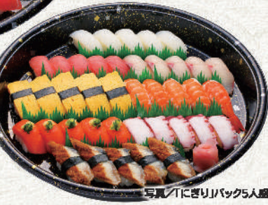
「にぎり」バック5人盛 6,600円(税込) 4人盛 5,280円(税込) 3人盛 3,960円(税込) 1人盛 1,320円(税込)