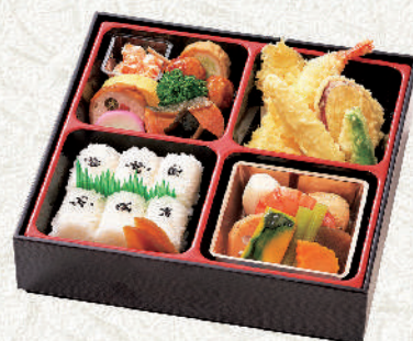
幕の内「古都」1,850円(税込) サイズ:24×24cm