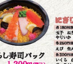
ちらし寿司バック 1,200円(税込)