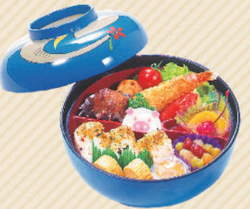
お子様弁当 1,100円(税込) おもちゃ付