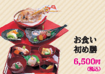
お食い初め膳 6,500円(税込)