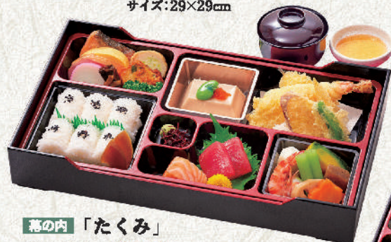
幕の内「たくみ」 お吸物・天だし付 3,240円(税込) サイズ:36.5×21.5cm プラス350円(税込)で赤箱に変更が可能です。