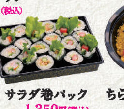
サラダ巻バック 1,350円(税込)