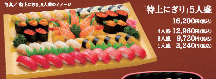
「特上」にぎり5人盛 16,200円(税込) 4人盛 12,960円(税込) 3人盛 9,720円(税込) 1人盛 3,240円(税込)

「寿司桶」に入れてお届けします ご要望に応じて、「ワサビ入り」「ワサビなし」「ワサビ別添え」や、「バック詰め」も承ります。 写真/「特上」にぎり5人盛のイメージ