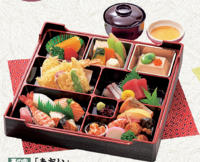
幕の内「あおい」 お吸物・天だし付 4,500円(税込) サイズ:29×29cm