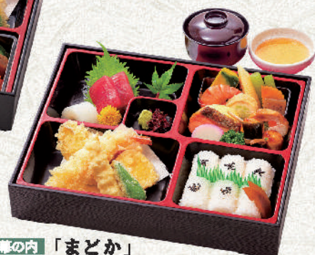
幕の内「まどか」 お吸物・天だし付 2,800円(税込) サイズ:30×25cm プラス350円(税込)で赤箱に変更が可能です。