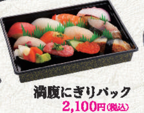
満腹にぎりバック 2,100円(税込)