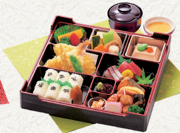
幕の内「みやび」 お吸物・天だし付 3,800円(税込) サイズ:29×29cm プラス350円(税込)で赤箱に変更が可能です。