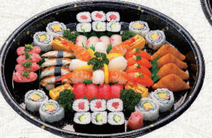
もり花バック 4~5人盛 7,800円(税込)