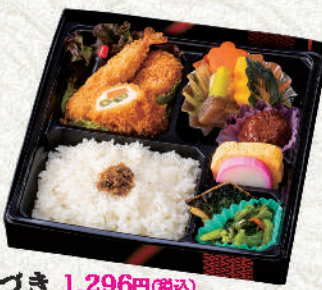
みかづき 1,296円(税込) (和洋) サイズ:22×22cm