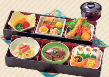
お子様膳 1,850円(税込) お吸物・おもちゃ付