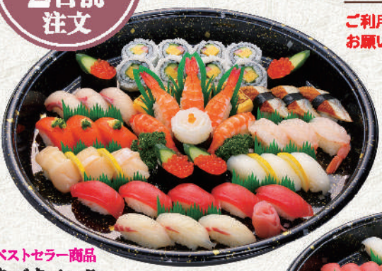
ベストセラー商品 あづまバック 4~5人盛 8,800円(税込)