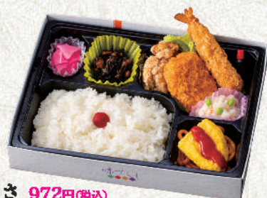
みかき 972円(税込) (洋) サイズ:24×18.5cm