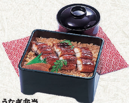
うなぎ弁当 お吸物付 1,800円(税込)